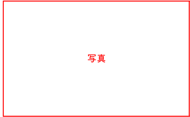
展示会の会場設営